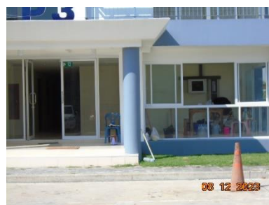
รูปที่ 2-1 สภาพโครงการในปัจจุบัน