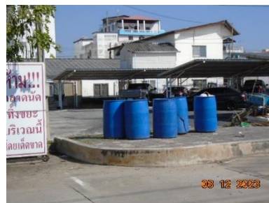
รูปที่ 2-6 ถึงขยะมูลฝอยทั่วไป