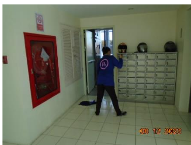
รูปที่ 2-8 พนักงานทำความสะอาด