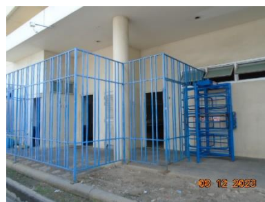
รูปที่ 2-5 ห้องน้ำ-ห้องส้วม