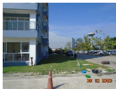
รูปที่ 2-3 พื้นถนนโดยรอบพื้นที่ก่อสร้าง