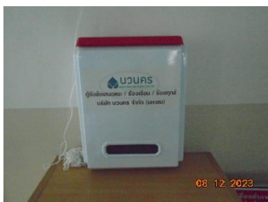
รูปที่ 2-4 กล่องแสดงความคิดเห็น