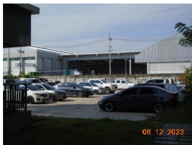
รูปที่ 2-7 พื้นที่จอดรถโครงการ